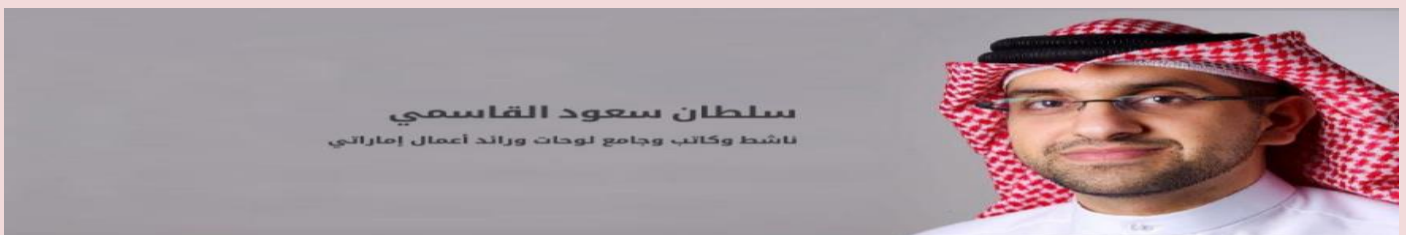
سلطان سعود القاسمي ناشط وكاتب وجامع لوحات ورائد أعمال إماراتي

القاسمي: سوء خدمات الاتصالات يعيق تحقيق رؤية الإمارات 2021